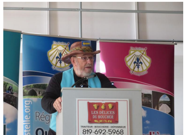
Le mot de bienvenue lors du Grand Rassemblement 2018.