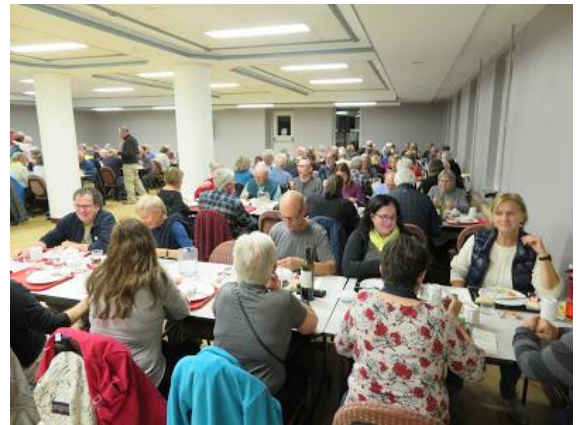
La journée qui se termine autour d'un souper agrémenté de chaleureuses discussions comme sur le Camino