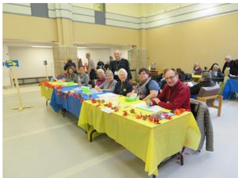
L'accueil des participants en 2018

N.B. Un oreiller et une couverture sont fournis par l'établissement, mais pas les draps.