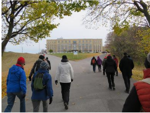
Le Mont-Bénilde au retour de la marche

Possibilité de dormir sur place. Capacité d'hébergement, près d'une centaine de pèlerins, soit :