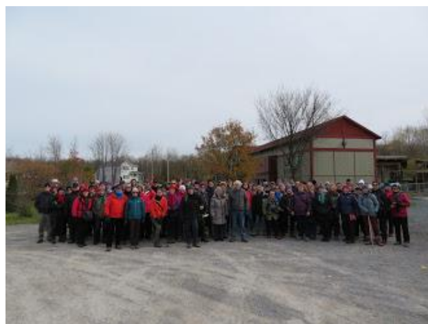
De nombreux participants à la marche de 2018

Différents produits en lien avec Compostelle seront proposés aux participants lors de cette journée